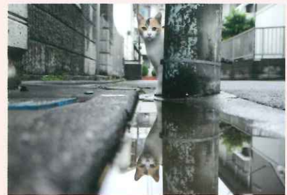
ひよっこりももちゃん (@Lemolatte)