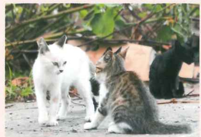
みあってみあって、はっけよ〜い (@たぬきねこ2)

主催・お問い合わせ 大佛次郎記念館（公益財団法人横浜市芸術文化振興財団） 〒231-0862 横浜市中区山手町113（港の見える丘公園内） TEL.045-622-5002 FAX.045-622-5071 http://osaragi.yafjp.org