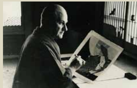
ポール・ジャクレー 軽井沢のアトリエにて、1953年

A l'occasion de l'inauguration de la Galerie de la Maison franco-japonaise