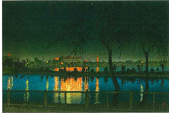
土屋光逸 夜之池畔(不忍池) 個人蔵