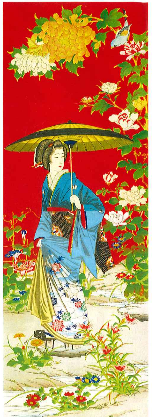
大倉孫兵衛田蔵錦絵画帖 当館寄託

＝展示構成＝ Welcome zone - 近代木版画の粋 Part1- 明治錦絵 - 大倉孫兵衛田蔵錦絵画帖の世界 - Part2- 大正新版画 - 世界が愛した近代の Ukiyo-e -