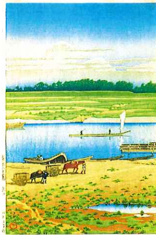
川瀬巴水 東京十二景 矢口 個人蔵

◆学芸員による展示解説【特別展+コレクション展】(申込不要) 13時30分開始 / 4月25日(土)、5月3・4(月・祝)・5(火・祝)・24・31日 6月7・14・21日 ※4月25日、5月4・5日以外は日曜日